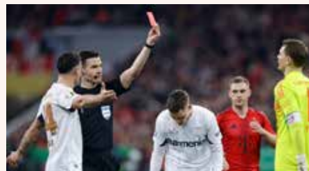
Мануэль Нойер получает красную карточку.

Подготовил Вера ГАЙЫПОВ, спортивный обозреватель.